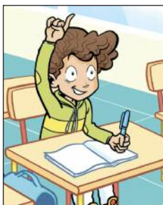
travailler en classe