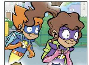
aller à l'école à pied