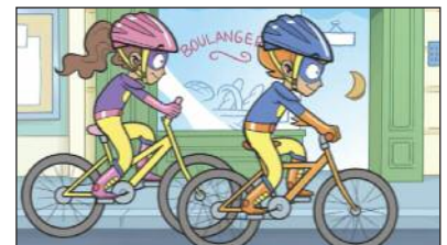
faire du vélo