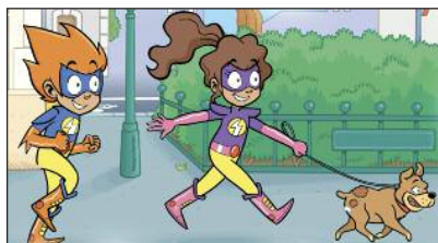
promener le chien