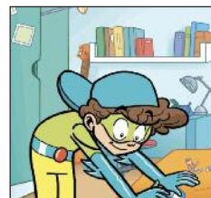
ranger sa chambre