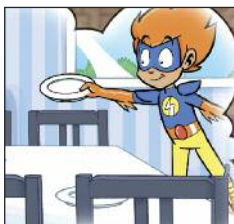
mettre la table

Tu le sais, Lulu souhaite faire partie des Zactifs ! Aide-le en entourant en vert les activités physiques et en rouge celles qui n'en sont pas. Pour t'aider, regarde le film "Bouger tous les jours, c'est facile" et souviens-toi de ce que dit Léna : "bouger ce n'est pas que faire du sport".